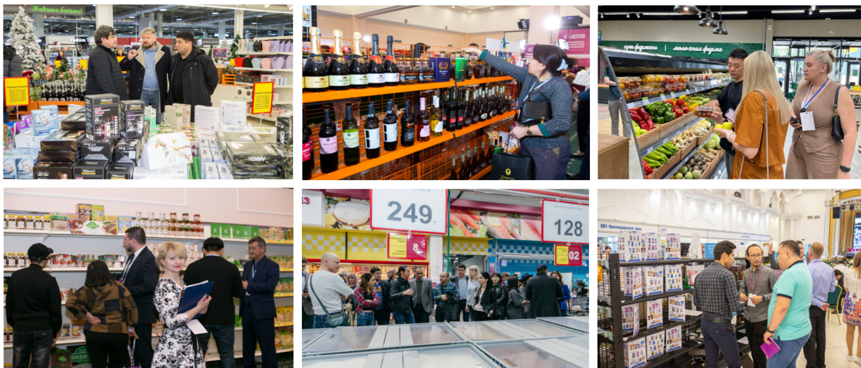
Фото экскурсий прошлых лет